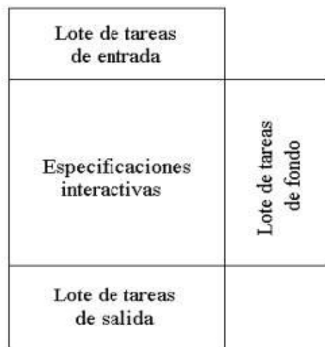
Figura 1: Componentes de una escena interactiva

La unidad básica de trabajo en multimedia es la escena interactiva, pantalla interactiva o página interactiva (la terminología varía en función del autor). Esto es, una pantalla a la vista del usuario que consta de los elementos que se plasman en la figura siguiente: